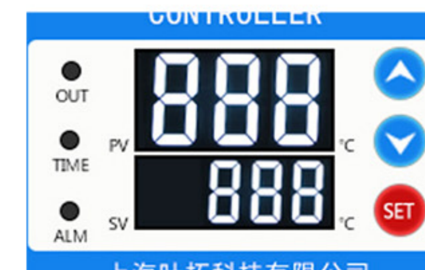
数字显示控制面板