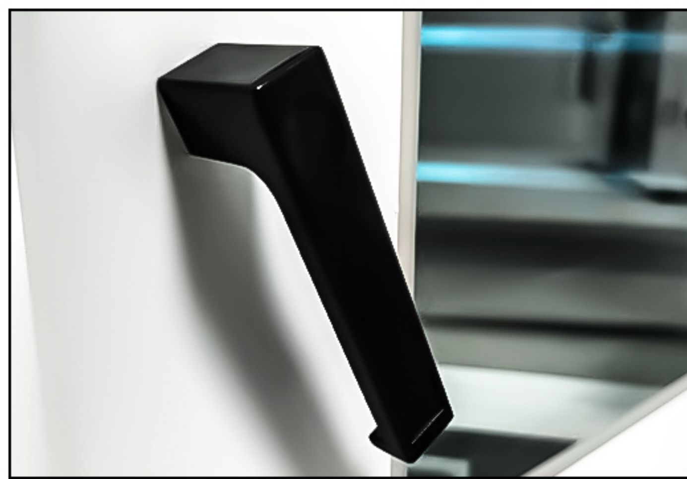
加厚玻璃门/门把手